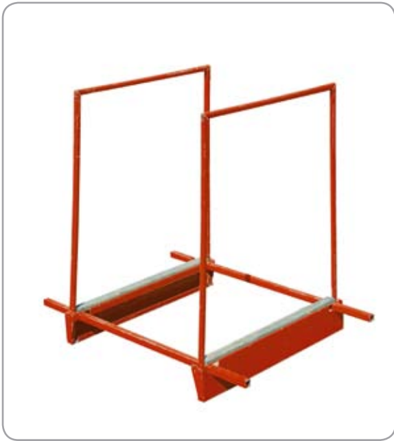
Stabil plåt- och rörkonstruktion.