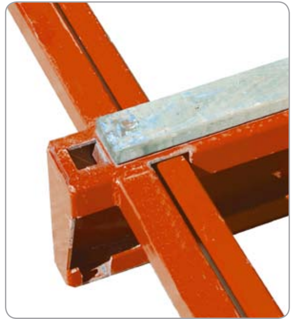
Slityta i rötskyddat trä.