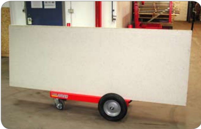
Lasten hverken generer udsynet eller rager langt ud over kanten

Pladevogn Minis to drejelige hjul, hvoraf et kan låses, betyder, at to personer nemt kan manøvrere vognen. Under transporten står pladematerialet sikkert, takket være lastfladens hældning. De lodrette bøjler, der også fungerer som håndtag, kan nemt skrues af, så vognen optager mindre plads, når den skal transporteres.