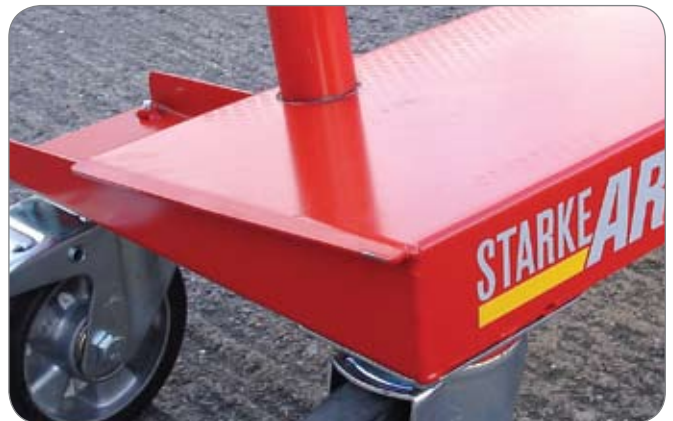
Den skrånende kant på den korte side betyder nedsat slitage på pladerne