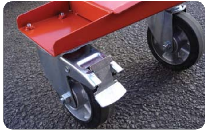
To svingbare hjul, hvorav ett er låsbart, på vognens bakdel