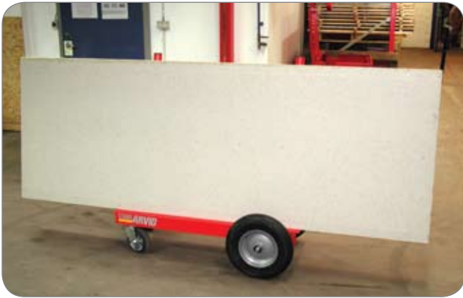
Lasten verken skjerner for sikten eller har stort overheng

Platetralle Mini har to svingbare hjul, hvorav ett er låsbart, hvilket gjør at to personer på enkelt vis kan manøvrere vognen. Under transporten står platematerialet sikkert, takket være lastoverflatens helling. De vertikale støttene, som i tillegg fungerer som håndtak, kan enkelt skrues løs, slik at vognen tar mindre plass når den skal transporteres.